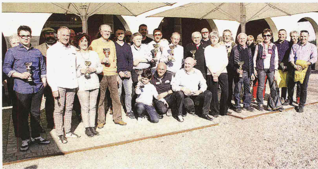
Passerella d'onore per piloti e navigatori delle macchine d'epoca che hanno preso parte al percorso turistico