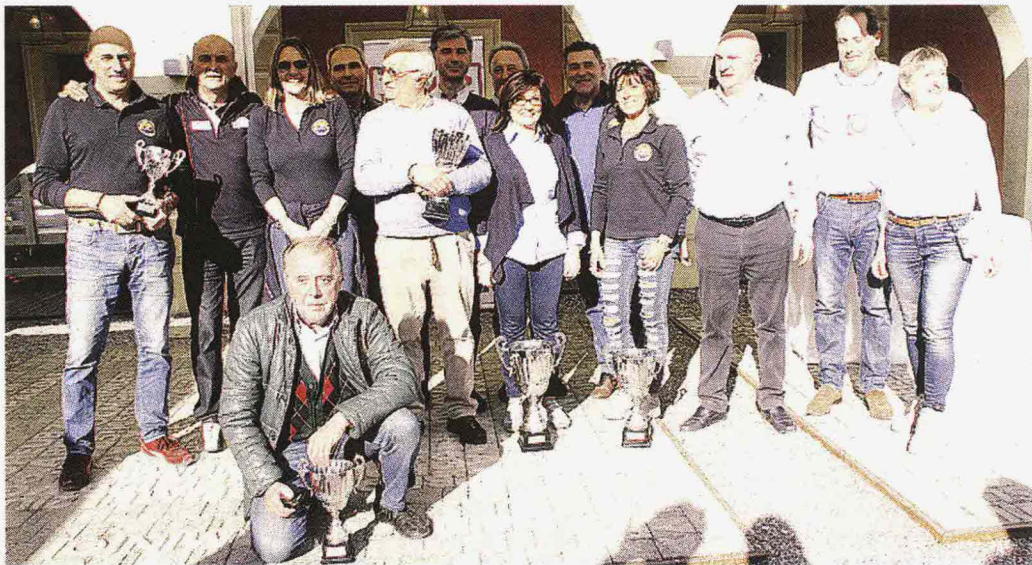
Gli equipaggi che si sono piazzati nei primi cinque posti nella gara di regolarità per le vetture del passato Gozzini

■ Come una festa di matrimonio, come una cena di classe con sara-banda di aneddoti da raccontare, come l'ultima scena di un bel film o semplicemente di una giornata da incorniciare: il rendez-vous alla Corte Biffi di San Rocco al Porto per il pranzo e le premiazioni del 23esimo memorial Castellotti ieri pomeriggio ha messo insieme tutte queste cose, complice il piacere della tavola che ha allentato le normali tensioni della cavalcata sulle quattro ruote, e lo spazio all'aperto dove i partecipanti alla Mille Miglia "bonsai" hanno potuto rilassarsi al sole e festeggiare tra battute e applausi i premiati. Un vero e proprio esercito, perché tra vincitori titolati e protagonisti delle varie categorie in classifica, il memorial ha regalato un momento di non trascurabile felicità a tutti, in una pioggia di trofei e omaggi che non ha scontentato nessuno. A cominciare dai primi cinque classificati della gara di regolarità inserita nel calendario nazionale Asi, campioni a livello nazionale in gare titolate, che hanno dato lustro