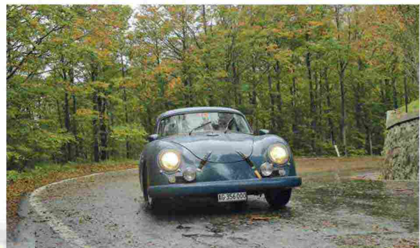
Terre di Canossa - Terzo classificato l'equipaggio Stefano Ginesi e Susanna Rohr su Porsche 356 A 1600 Super del 1959.